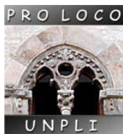
Ruvo di Puglia