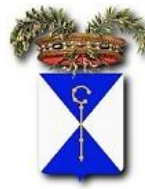
Provincia di Bari